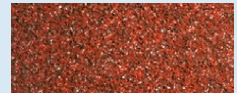
PAVIGYM BRICK TURF