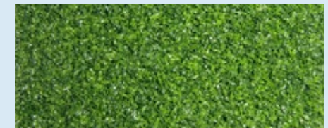
PAVIGYM GREEN TURF

*Der Aspekt und die Farbe auf den Bildern können leicht vom Originalprodukt abweichen.