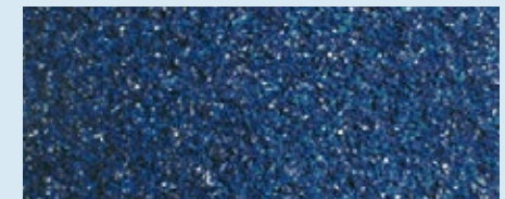
PAVIGYM BLUE TURF