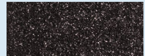
PAVIGYM BLACK TURF