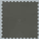
PAVIGYM STONE G.