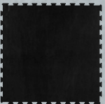
PAVIGYM B. MARBLE