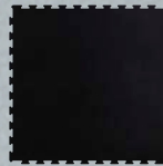
PAVIGYM JET BLACK