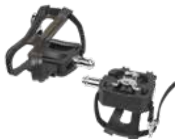
Standard Morse Taper Double Link™ Pedale