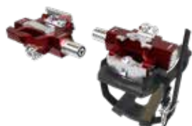
Morse Taper Triple Link™ Keo-kompatible Pedale