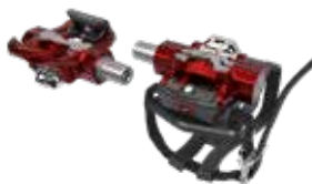
Morse Taper Triple Link™ Delta-kompatible Pedale